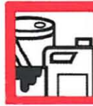
ENVASES VACIOS DE PINTURA Y BARNICES 4 BIDONES