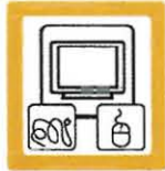
RESIDUOS ELÉCTRICOS 2 unidades