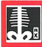
RADIOGRAFIAS 10 unidades