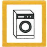
ELECTRODOMÉSTICOS 2 unidades