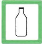
VIDRIO 25 Kg ( 2 samuros )