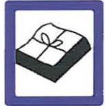
PAPEL Y CARTÓN 25 Kg

Las cantidades o volumen de residuo que puede dejar en el Punto Limpio en una visita están reflejadas en un cartel a la entrada del recinto. También puede consultar al operario o hacer la consulta por teléfono.