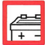
BATERÍAS 2 unidades