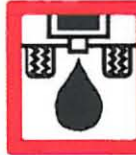
ACEITES MINERALES 10 Litros