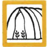
OTROS PLÁSTICOS Consultar