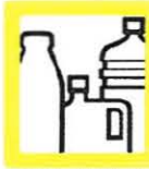
ENVASES DE PLÁSTICO 1m 3