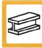
METALES (Férricos y no férricos) Consultar