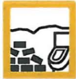
ESCOMBROS 8 SAMUROS