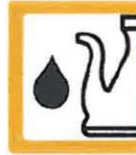
ACEITE VEGETAL 10 Litros (-10Kg. con envase)