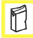
TETRABRIKS 1m 3