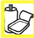
ENVASES METÁLICOS 1m 3