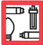
FLUORESCENTES 5 unidades