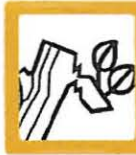
RESTOS DE PODA 2m 3