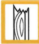
MADERA 1m 3